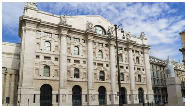
La ricerca sul mercato delle PMI effettuata da Value Track, boutique di analisi finanziaria e corporate finance indipendente

(Teleborsa) - Il 2021 è stato un anno molto positivo per Euronext Growth Milan (EGM, già AIM Italia), il segmento di Piazza Affari dedicato alle PMI dinamiche e competitive, sia in termini di attività di capital markets e performance di borsa che in termini di performance economico-finanziaria delle diverse società quotate. In particolare, è possibile trarre alcuni messaggi chiave dai bilanci 2021 pubblicati nelle scorse settimane: dopo l'anno difficile della pandemia, l'EGM è tornato sul percorso di crescita anche rispetto al 2019; sempre più aziende EGM stanno raggiungendo dimensioni rilevanti; in media c'è una struttura del capitale ben bilanciata. Lo sostiene un nuovo report sul mercato EGM pubblicato da Value Track, boutique di analisi finanziaria e corporate finance indipendente.