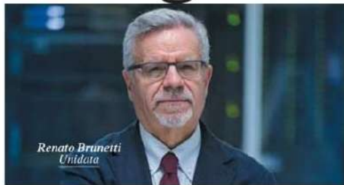
Renato Brunetti Unidata

stare servizi e a svolgere attività nel settore data center in favore di clienti che richiedano di usufruire di servizi di data center con una potenza inferiore a 30kw. La costituenda UniCenter sarà partecipata al 75% dal